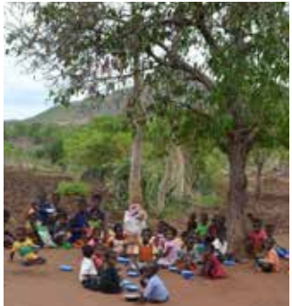
L'asilo sotto l'albero. I bambini mangiano solo semolino....

Molti bambini vengono alla Scuola anche da molto lontano senza aver mangiato nulla e attendono con ansia il loro prezioso pasto quotidiano di semolino.